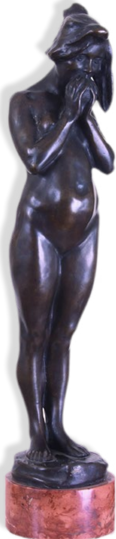
Horvay János: Éva, 1900 körül (A Városi Képtár - Deák Gyűjtemény tulajdona)