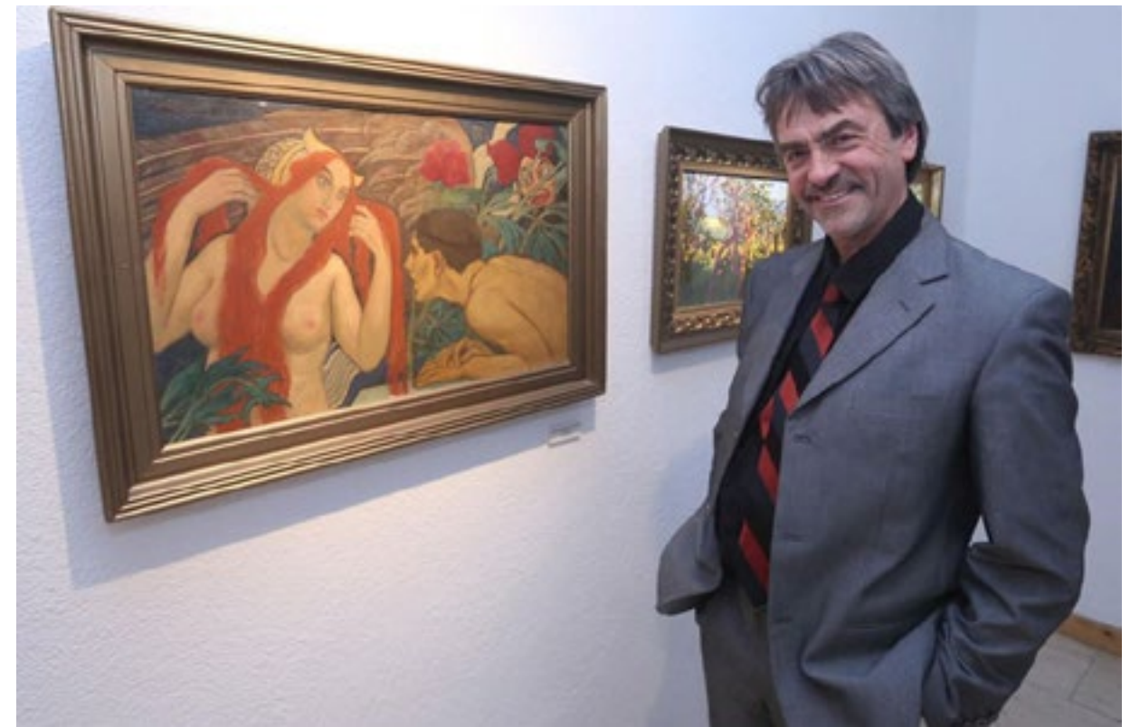
Kriesch György a Váropsi Képtárban

december 2-án, szerdán 14 órakor. A nyeremény: 2 éjszaka reggelivel 2 fő részére az Erzsébet Királyné Hotelben ***, Gödöllőn