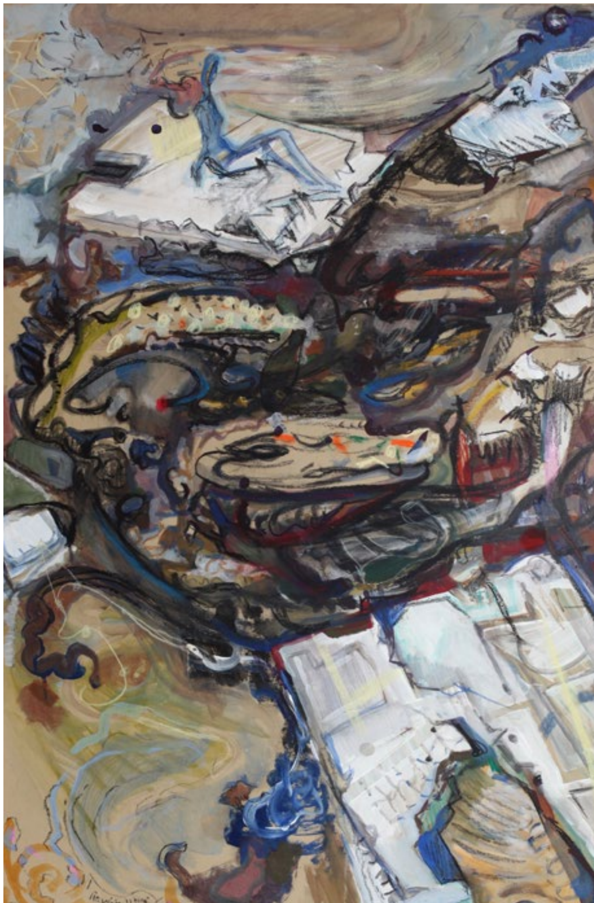
Revák István: A jég hátán is megél, 2015 (részlet)