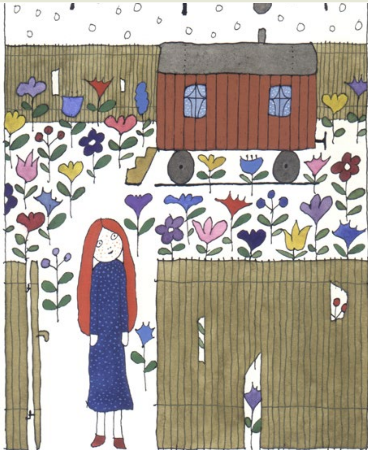
Réber László grafikája (Berzsián és Dideki)