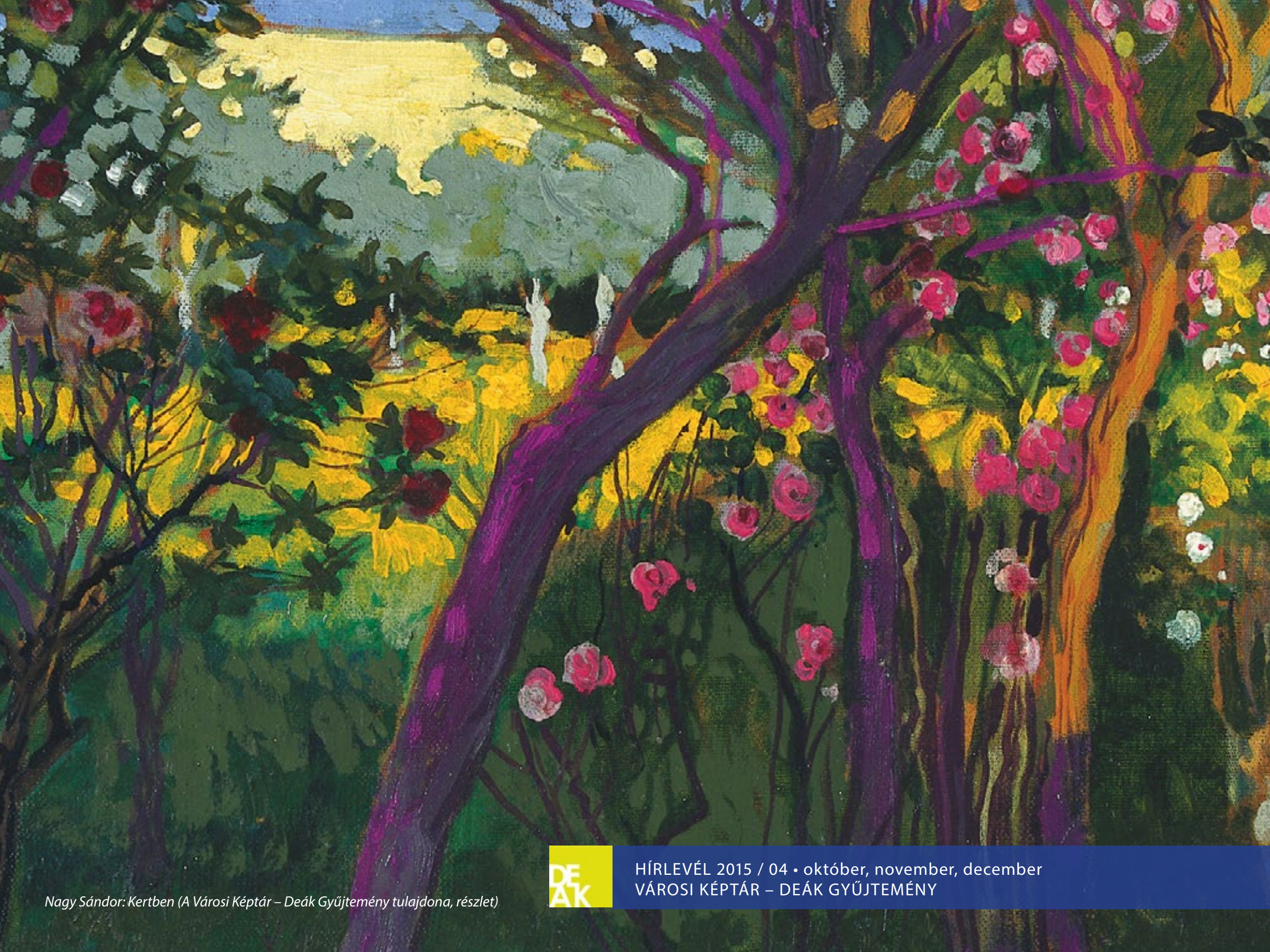
Nagy Sándor: Kertben (A Városi Képtár – Deák Gyűjtemény tulajdona, részlet)