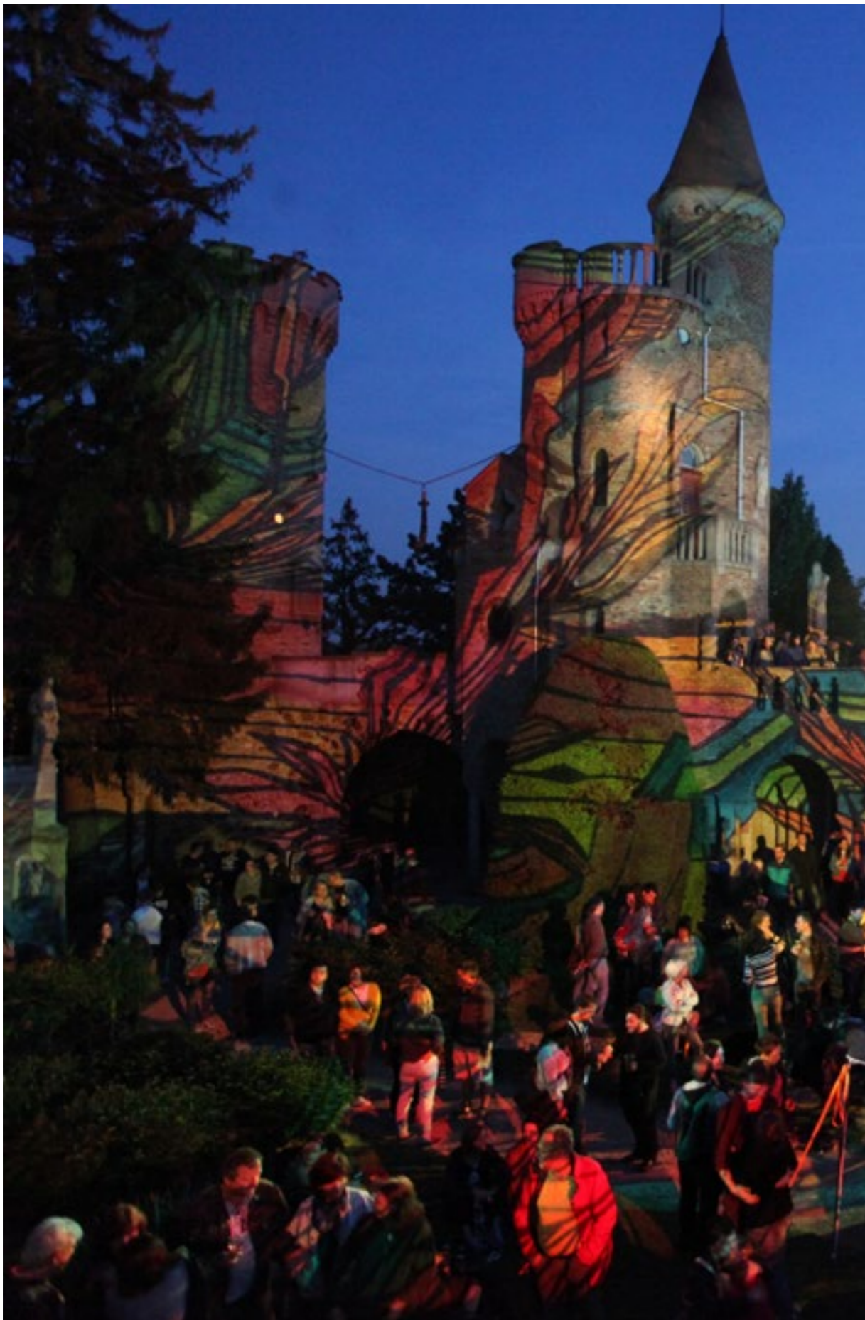
Jam-Bory-Vár a 16. Kortárs Művészeti Fesztiválon (Méhkas Dla Project)