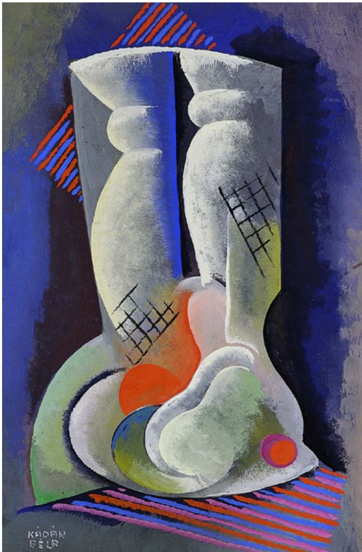
Kádár Béla: Csendélet, 1935 körül