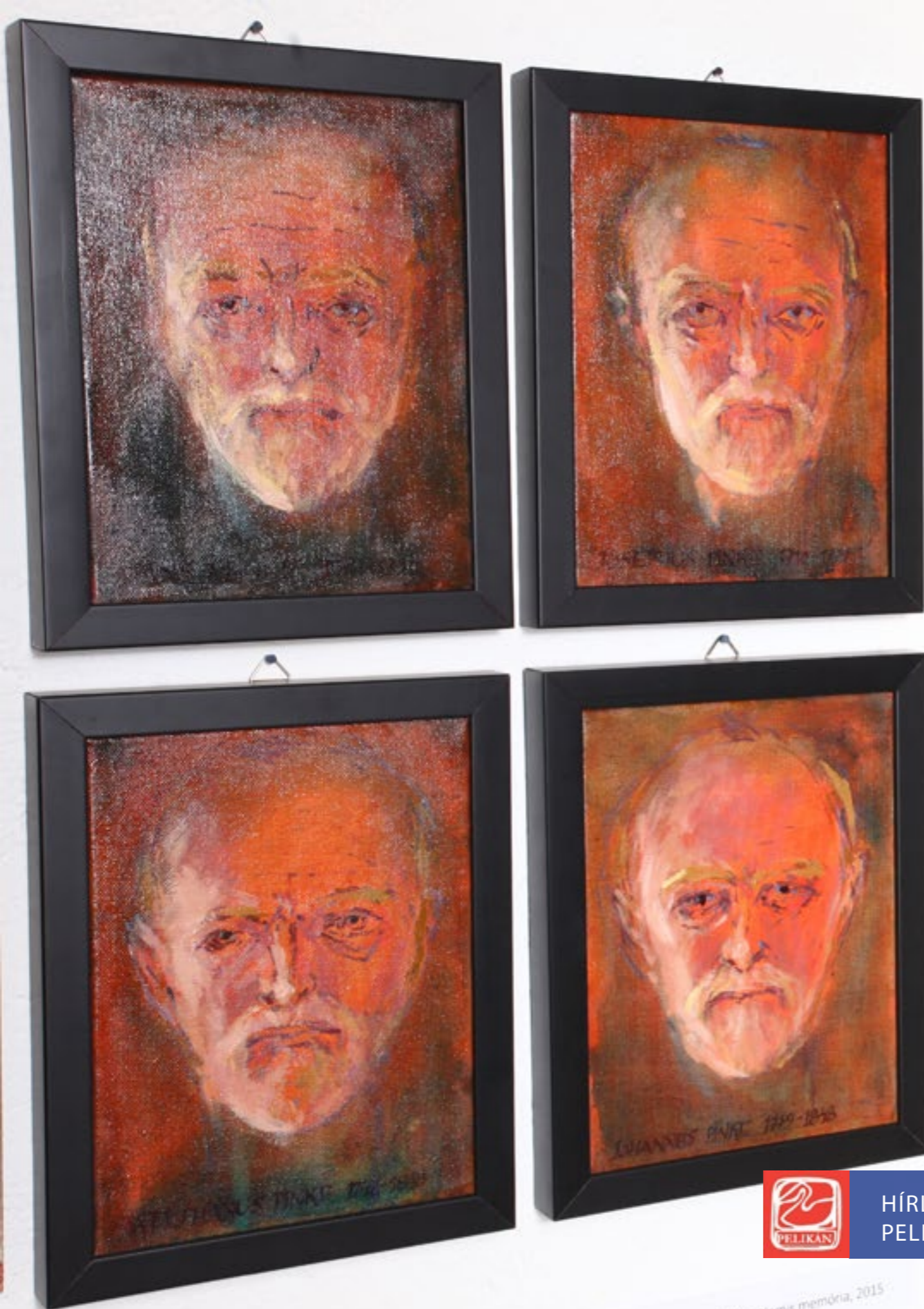
A Hamis Memória című kiállítás enteriőre