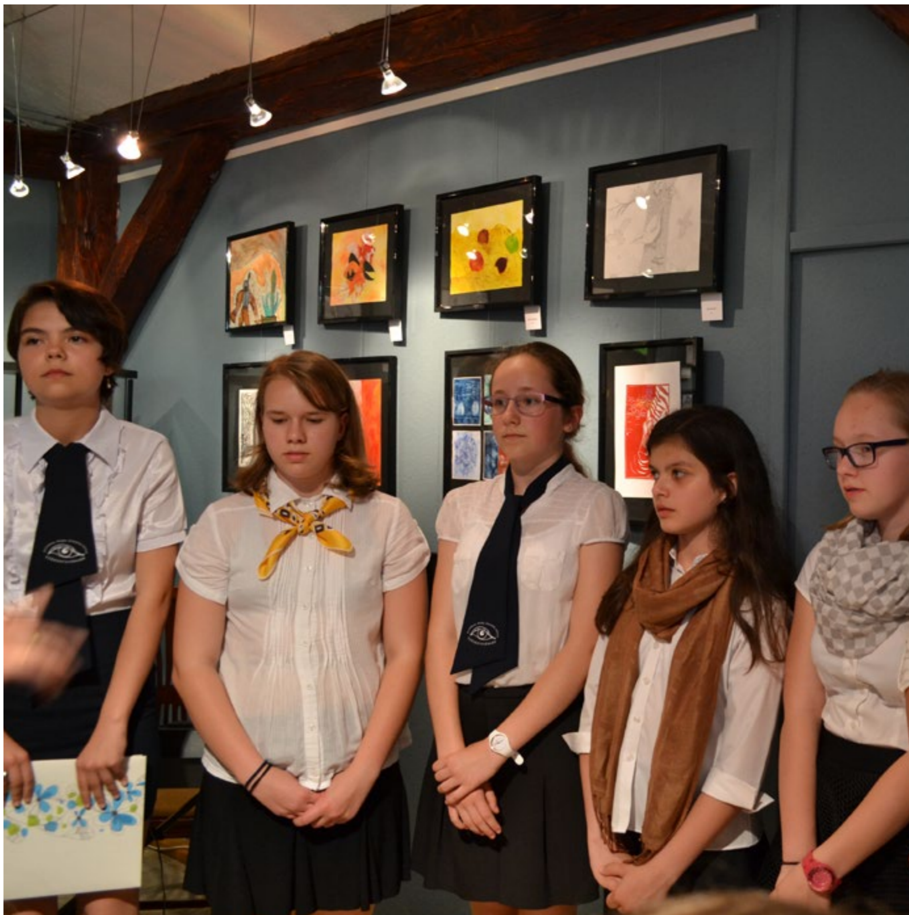
Megnyitó a Diák–Deák Galériában