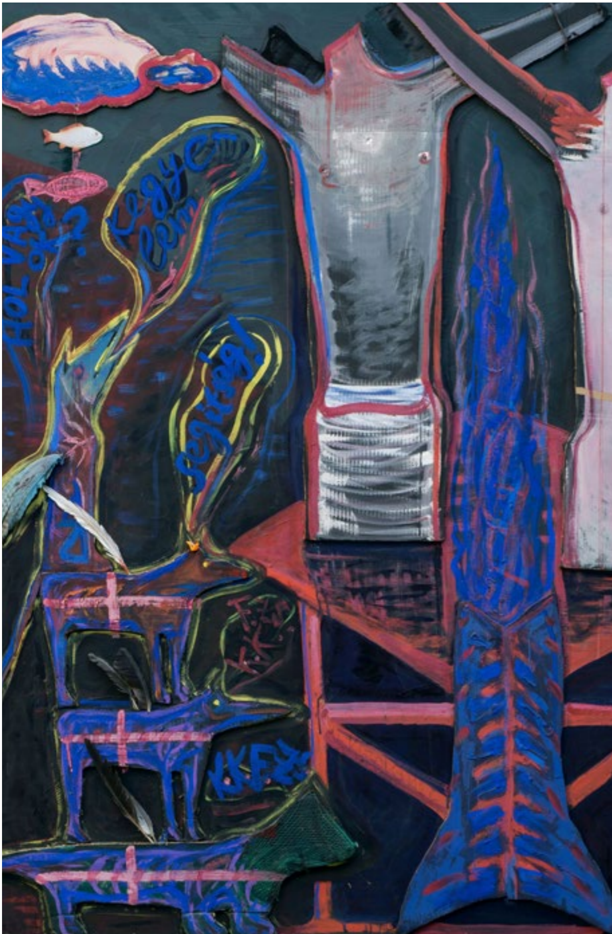
El Kazovszki: Áldozatbemutatók (Áldozathozók), 1995 körül (részlet)