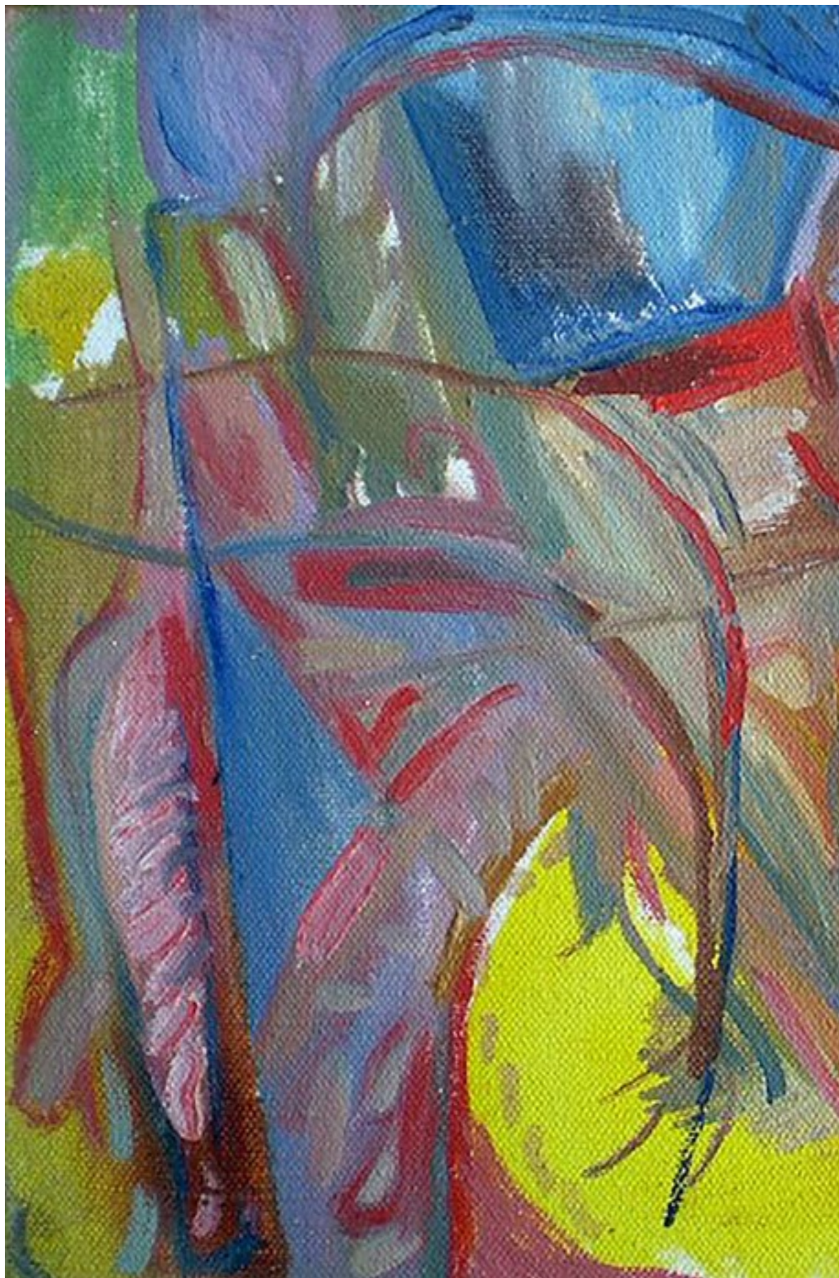
Revák István: Dombos táj (részlet)