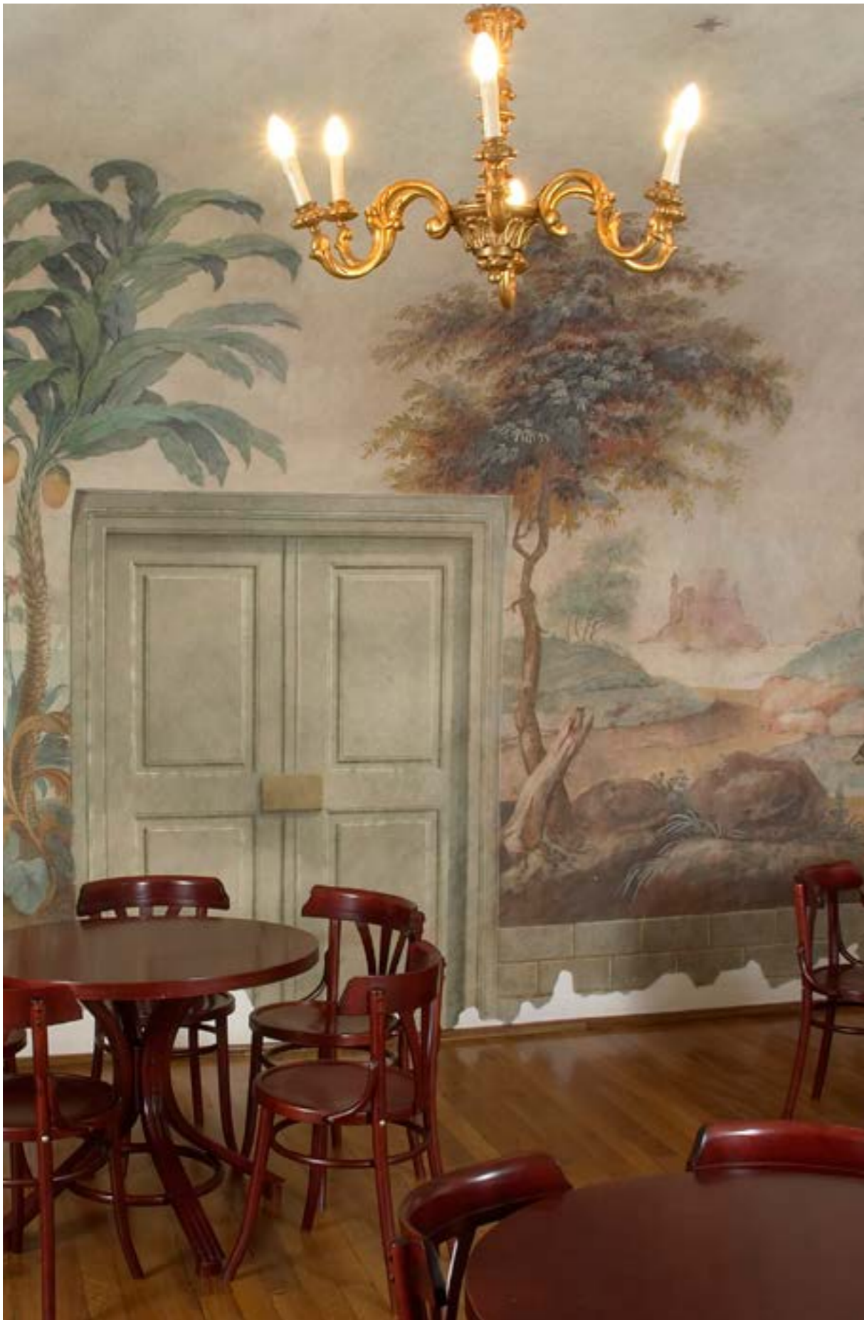
A Képtár freskós terme