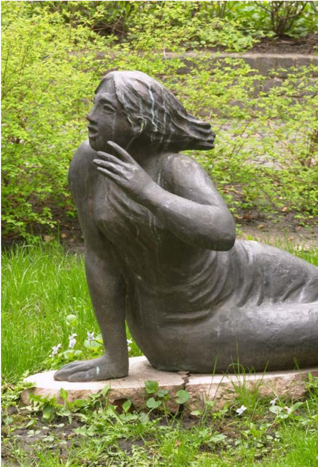
Borsos Miklós: Tihanyi Echo, 1980-as évek