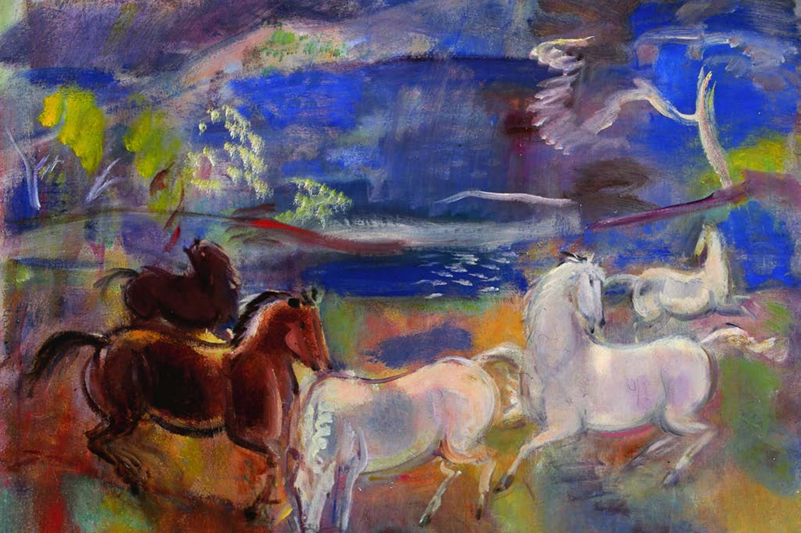
Márffy Ödön: Tavasszal (Lovak a vízparton; Lovak), 1940-es évek (részlet)