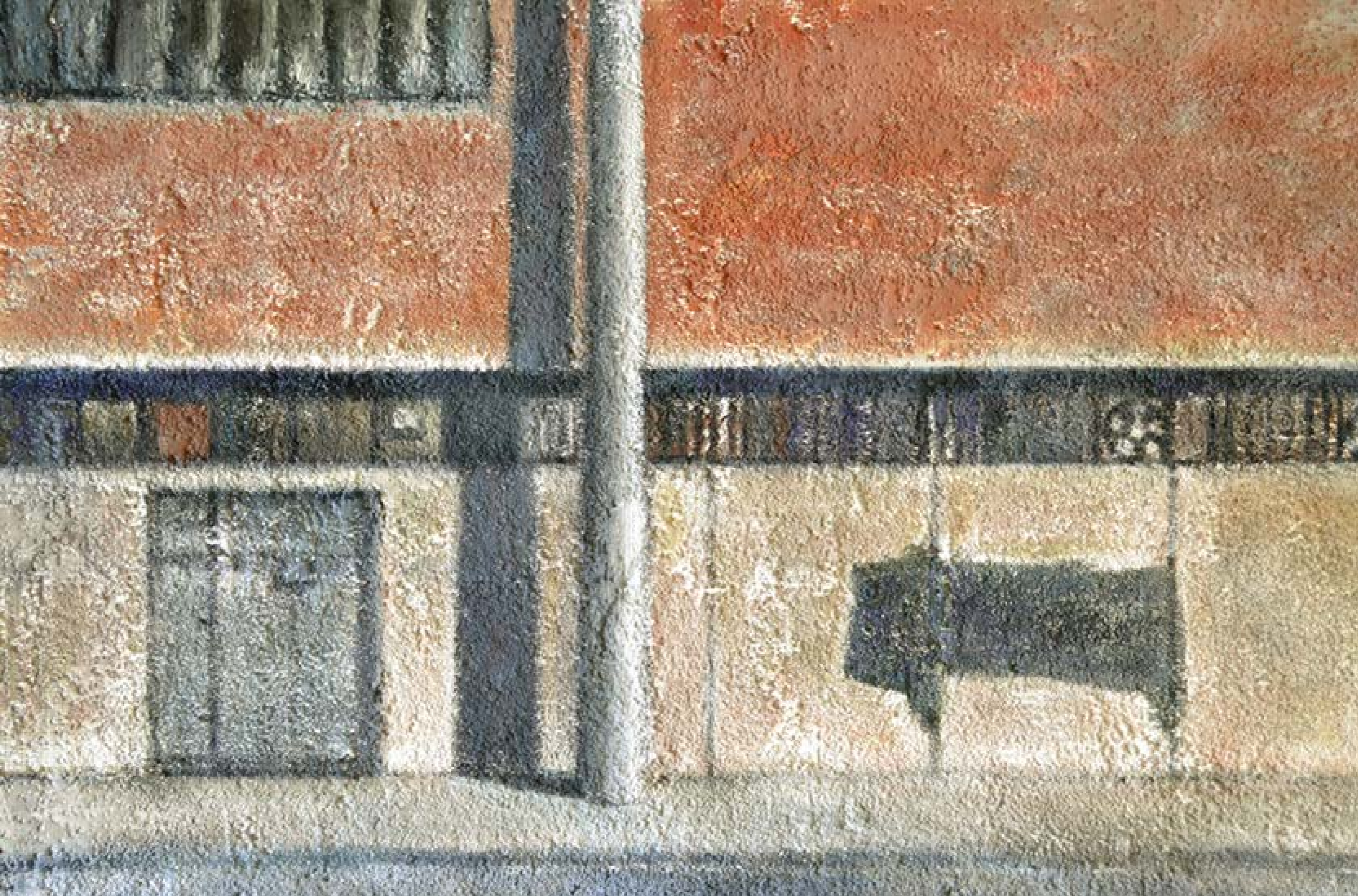
Pácser László: Megálló (2015)