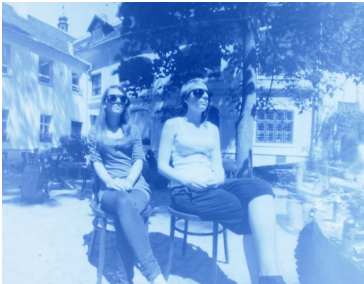
Camera Obscura fotó a Városi Képtár nyári fotótáborából