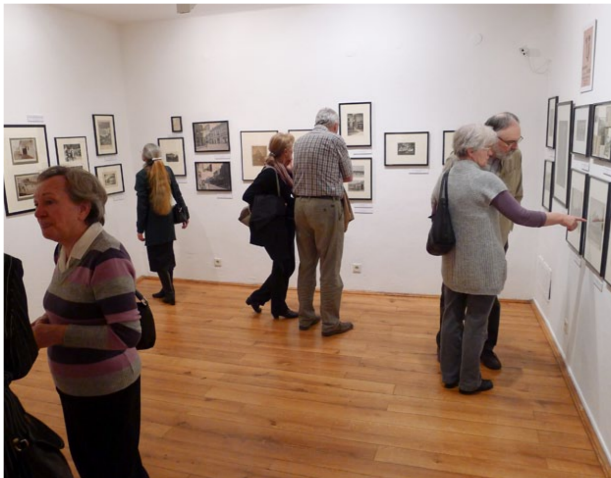
Az Emlékmentés kiállítás megnyitója

VÁROSI KÉPTÁR – DEÁK GYŰJTEMÉNY 8000 Székesfehérvár, Oskola u. 2-4.