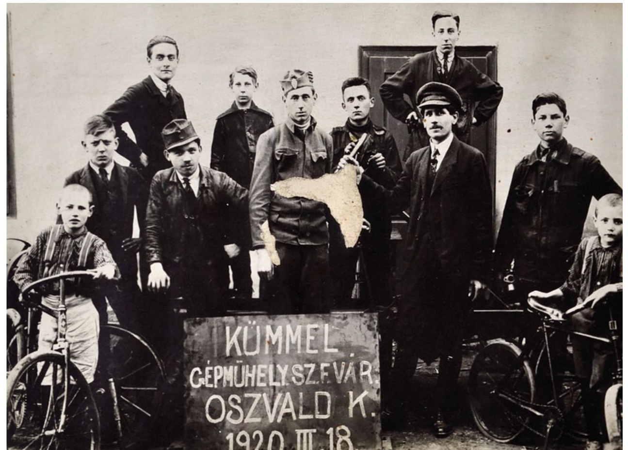
Csoportkép, 1920 (Oroszlán Balázs tulajdona)

2013. február 12-étől, ingyenes tárlatvezetéseket tartunk, külön-külön az egyes szakmák (orvosok, városvédők, ügyvédek, művészek, kereskedők, iparosok) képviselői számára.