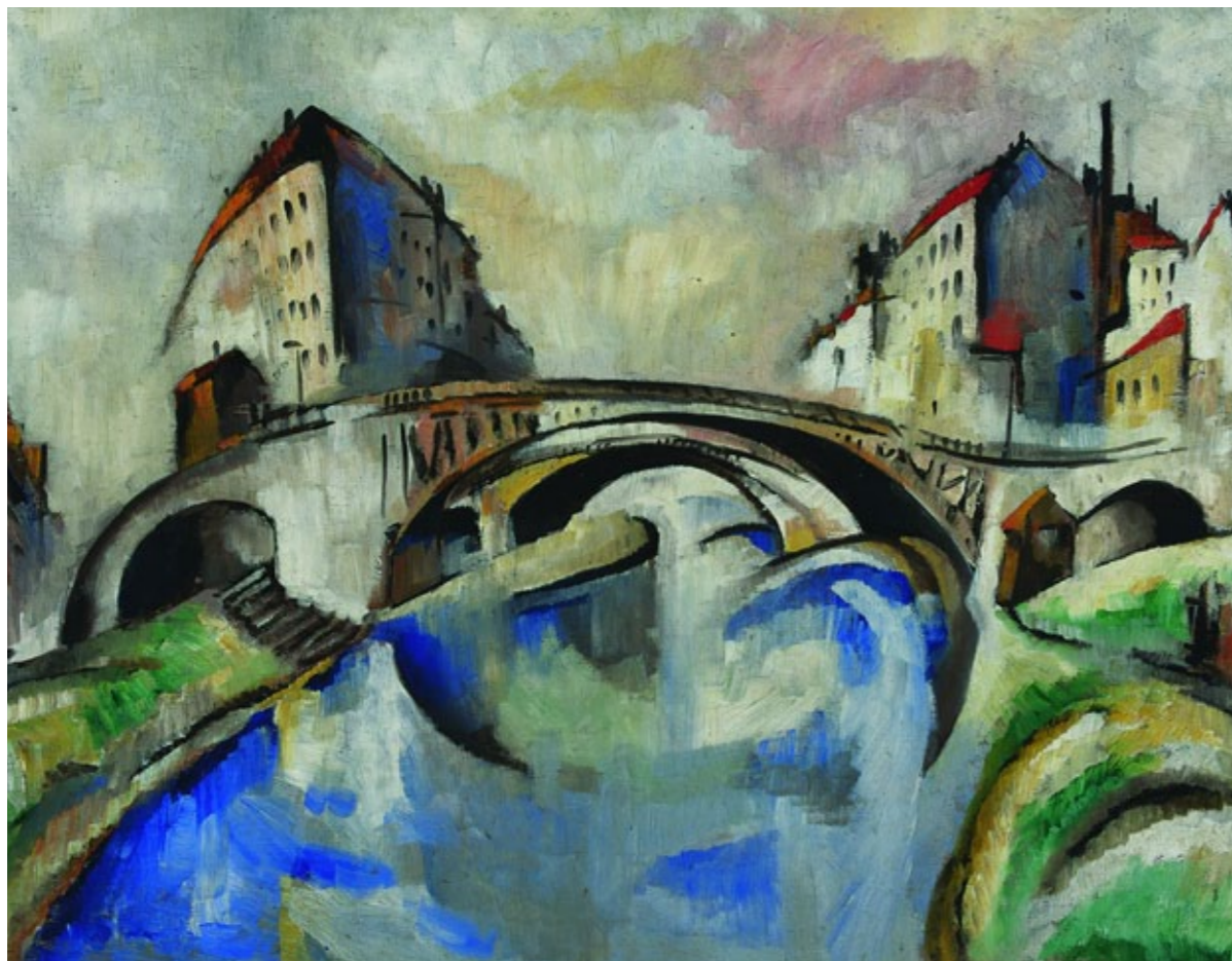
Kádár Béla: Hidas városkép, 1910 körül

Városi Képtár – Deák Gyűjtemény Székesfehérvár, Oskola u. 10.