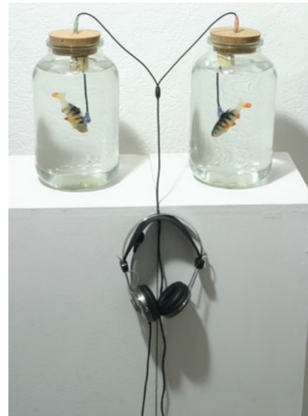
Haraszi Zsolt: Stereo (2013)