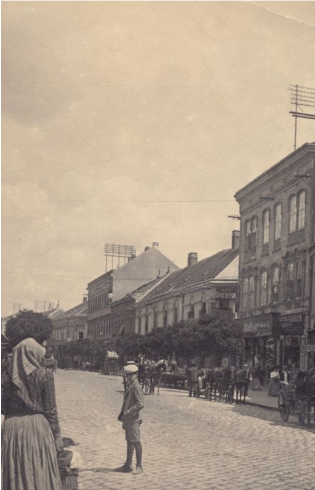
Székesfehérvár Nádor utca (a mai Fő utca), 1912