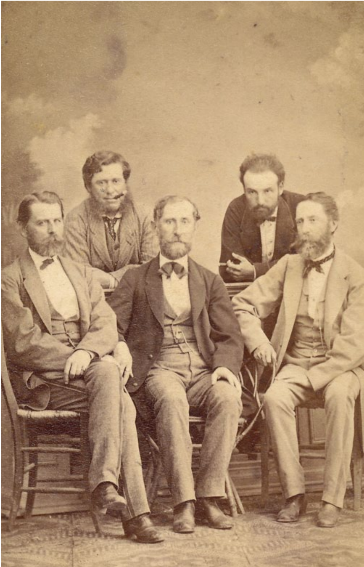
Csoportkép, 1870 körül