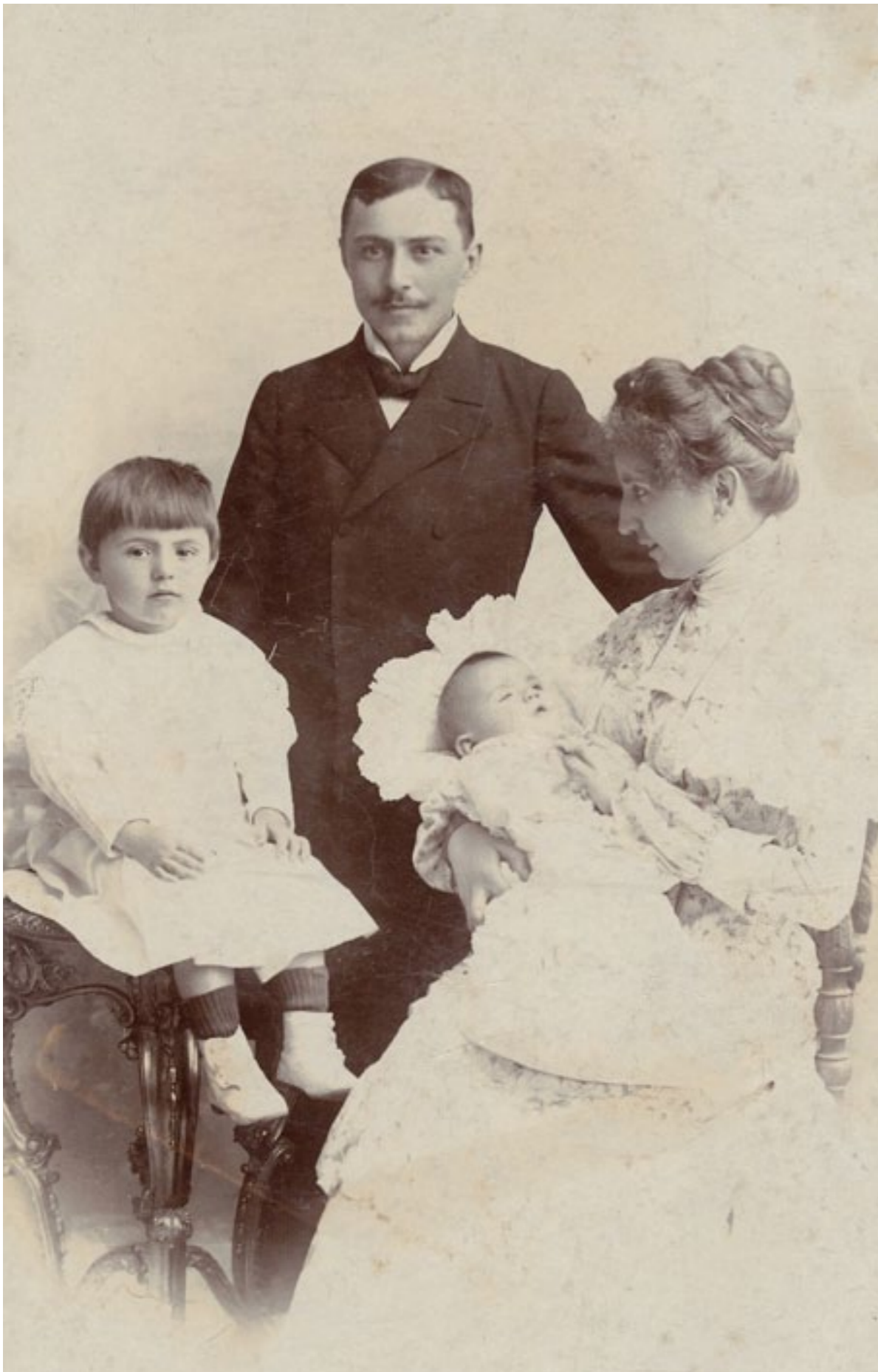
Családi fotó, 1890 körül